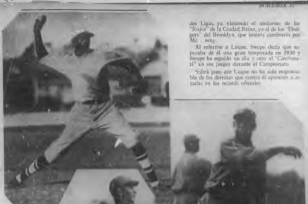
Pelajo, el jefe de los "magrinos" del "Santa Clara", le resultó en difícil, derrotado a los "magrinos" habaneros en su último encuentro.

"Almendro", "Habanero" y "Santa Clara" pueden considerarse para vencer, pero