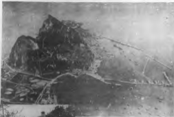
Vista del Peñón de Gibraltar