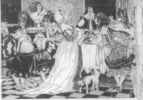
ILUSTRACIONES DE JORDAN